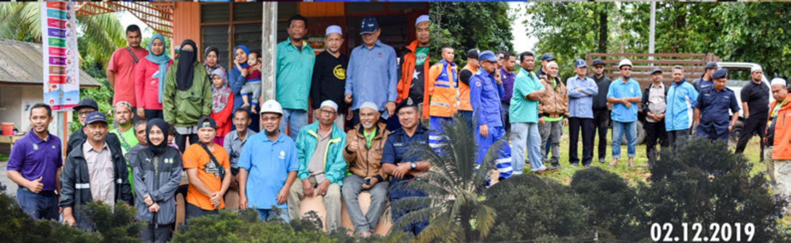
02.12.2019 LAWATAN KE KAWASAN BANJIR DAN PUSAT PERPINDAHAN BERSAMA TUAN PEGAWAI DAERAH DUNGUN