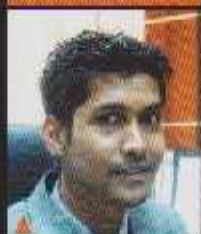
AHMAD FAISAL B. SAIFUDDIN Maksutan