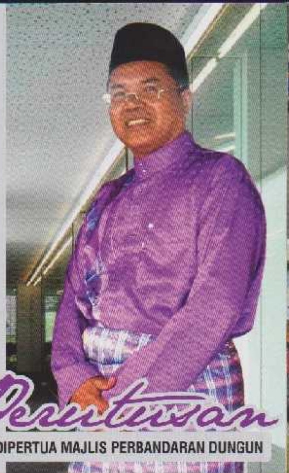
Perutusan YANG DIPERTUA MAJLIS PERBANDARAN DUNGUN